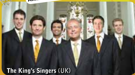
The King's Singers (UK)

Kuorojen ilmoittautuminen viim. 15.3.2012 Anmälning av köreerna senast 15.3.2012