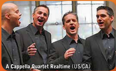
A Cappella Quartet Realtime (US/CA)