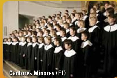
Cantores Minores (FI)