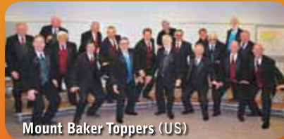
Mount Baker Toppers (US)