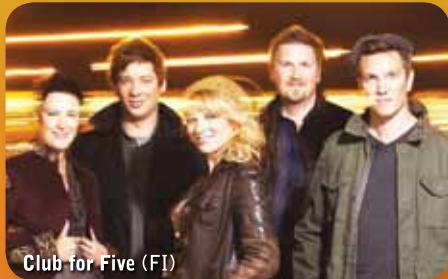
Club for Five (FI)