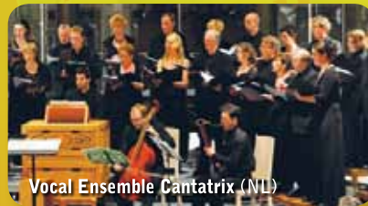
Vocal Ensemble Cantatrix (NL)