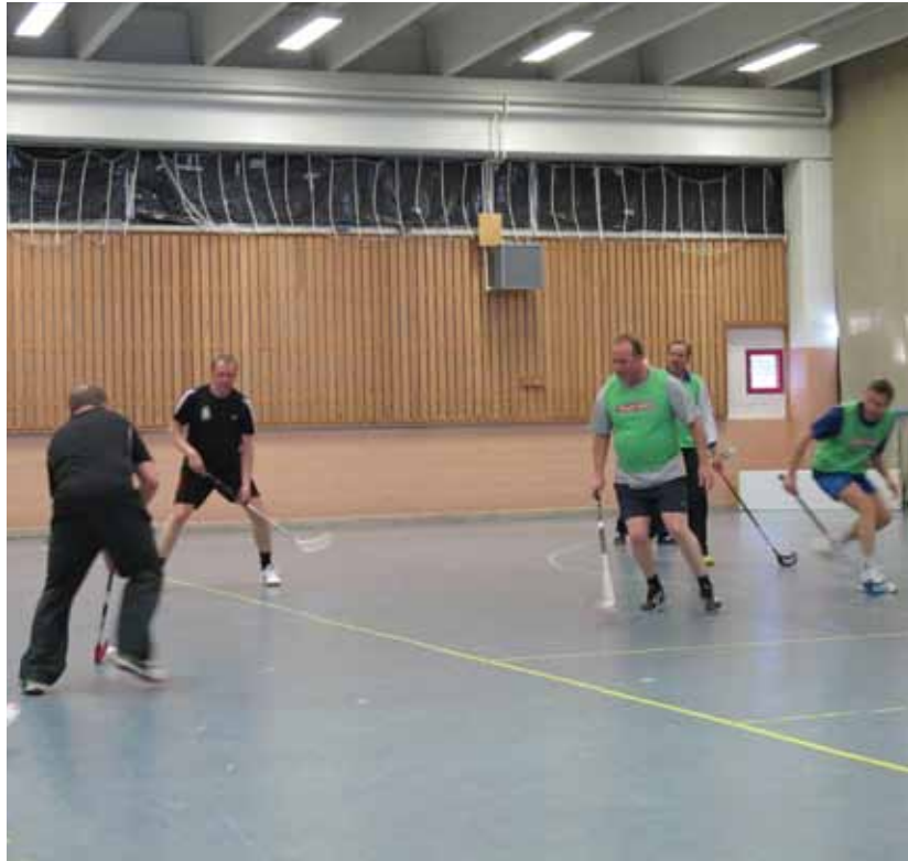
Kuntatekniikan sählyvuorolla lentää sekä hiki että läppä.

Kuntatekniikan henkilökunta käyttää tykyavustustaan myös muuhun yhteiseen toimintaan. Pääasia on yhteinen tekeminen ja liikunnan ilo. Kesken työpäivän suoritettu reipas puolittainen liikuntahetki lisää myös vireyttä loppupäivän askareisiin. Eikä tämän porukan liikkuminen ei ole pelkästään sählynpeluuta.